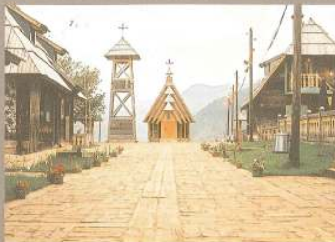
Van Kesteren - Grootenboer